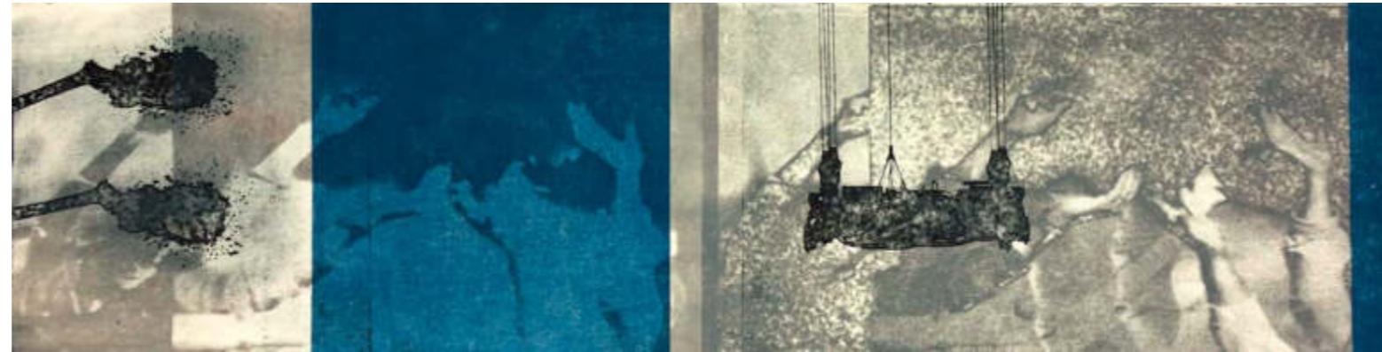
o.T., 2020, Motiv 20 x 78, Blatt 56 x 78 cm Intagliotypie auf 300g-Bütten, Unikat