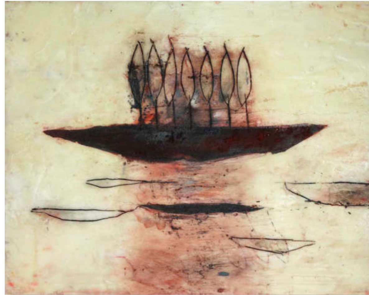
- unterwegs -, 2020 32 x 39 cm Öl auf Wachs, Kupferdruckkarton