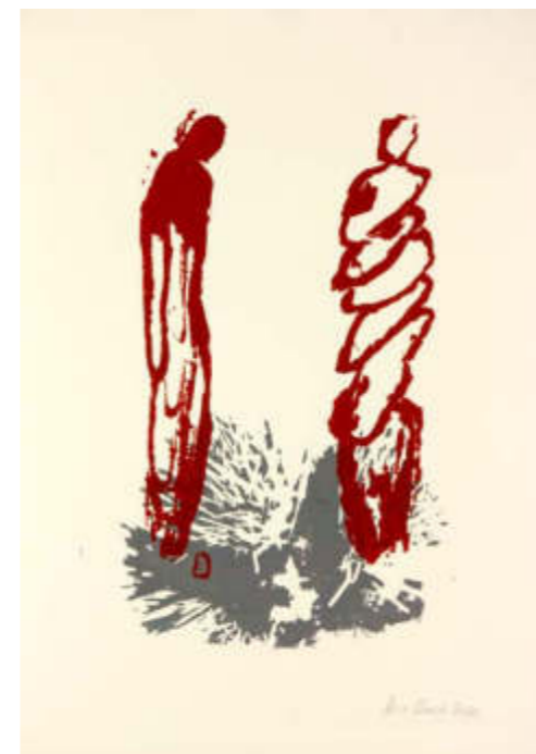
o.T., 2020, Motiv ca. 22 x 35, Blatt 35 x 50 cm Siebdruck, Unikat