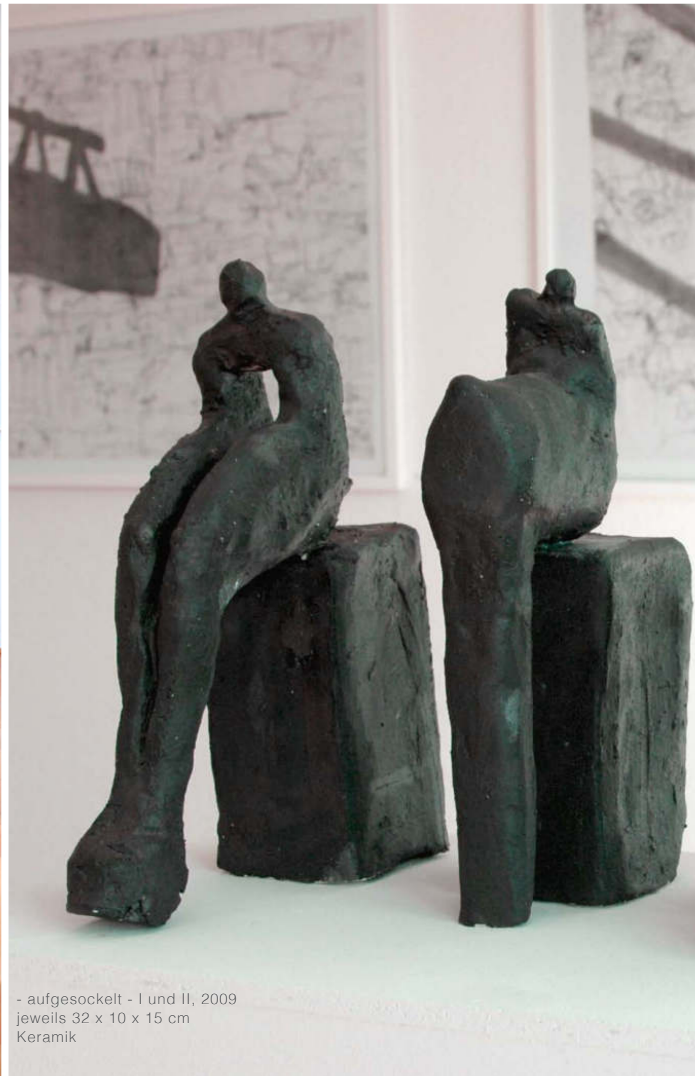
- aufgesockelt - I und II, 2009 jeweils 32 x 10 x 15 cm Keramik