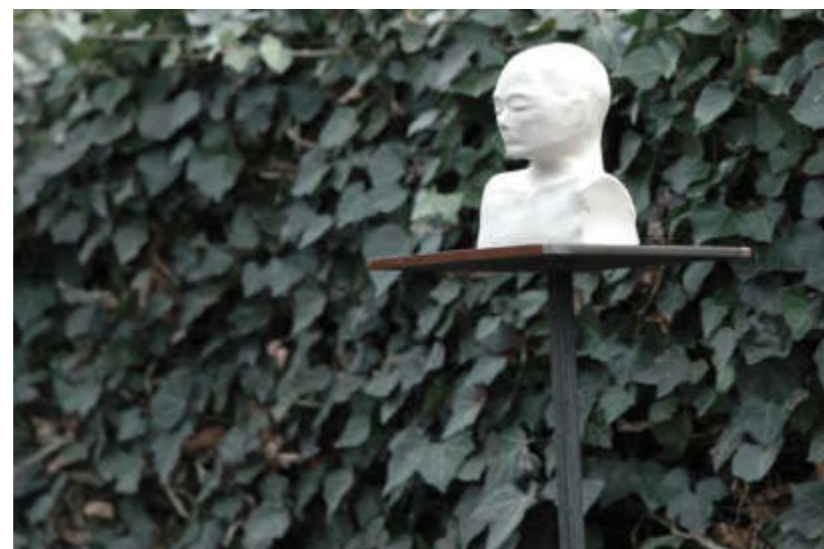
- Auszeit -, 2019 Installation mehrteilig Keramik, je. 15 x 12 x 9 cm Stahlsockel Höhe ca. 170 cm