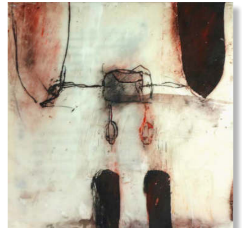
- dazwischen -, 2020 25 x 25 cm Öl, Wachs, Mischtechnik