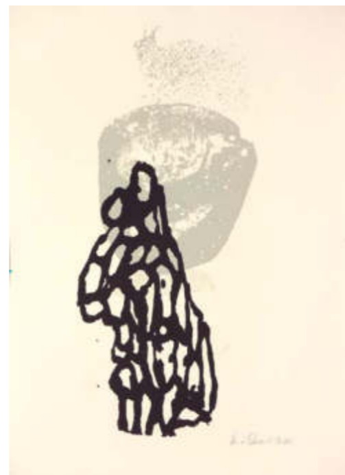
o.T., 2020, Motiv ca. 22 x 35, Blatt 35 x 50 cm Siebdruck, Unikat