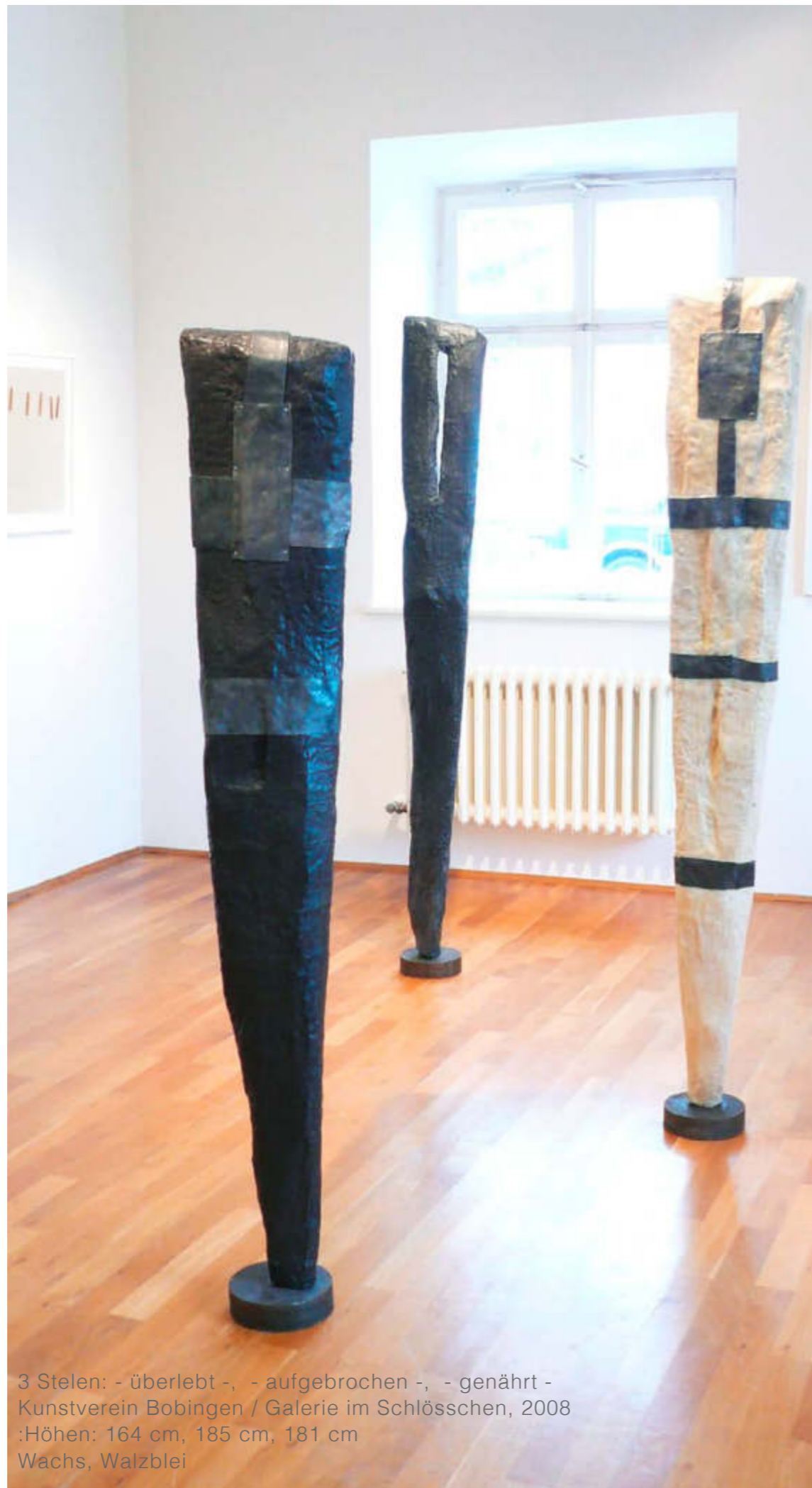
3 Stelen: - überlebt -, - aufgebrochen -, - genährt - Kunstverein Bobingen / Galerie im Schlösschen, 2008 :Höhen: 164 cm, 185 cm, 181 cm Wachs, Walzblei