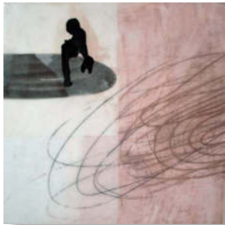
o.T., 2020, 30 x 30 x 3 cm Collage unter Wachs auf Holzkörper