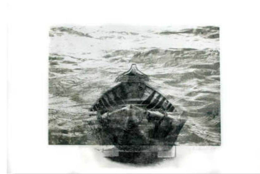
- übers Meer -, 2018 Motiv ca. 29 x 42, Blatt 50 X 65 cm Transferlithografie auf Bütteln und Seidenpapier

Die künstlerische Arbeit als ein Weg, um über die Welt nachzu- denken: Was trägt uns in unserem Menschsein? Wie können wir uns verorten und sind doch konfrontiert mit der Eigengesetzlichkeit der uns umgebenden Welt, mit der Wandel- barkeit, Doppeldeutigkeit und Viel- schichtigkeit? Im Zentrum meiner plastischen Arbeit steht der Mensch, wobei nicht Äußeres interessiert sondern innere Befindlichkeiten. Dabei nutze ich vorwiegend Ton und Wachs. Bei Letzterem fasziniert mich die Plastizität, aber auch die Transpa- renz und das Verletzliche, das ich damit assoziiere. Porzellan korre- spondiert mit neuen Themen: die Natur als Grundlage des Lebens, ihre Fragilität und Schutzbedürf- tigkeit, auch die des menschlichen Daseins. Die grafische Arbeit bietet die Mög- lichkeit, der Vielschichtigkeit von äußerlich Sichtbarem und inneren Befindlichkeiten z.B. durch Schich- tungen transparenter Papiere oder mit Wachs eine Sprache zu geben. Mich faszinieren Kraft, Brüchigkeit und Flüchtigkeit der Linie, Schwarz- Weiß ist mir näher als Farbe. In der Druckgrafik (inzw. nur noch mit den Möglichkeiten des Nontoxic-Prin- ting) werden Zeichnungen und eige- ne Fotografien zu neuen Bild- räumen kombiniert. Reduktion und Veränderung der Formen und ihre Kombinationen eröffnen Denkräume für Assoziationen.