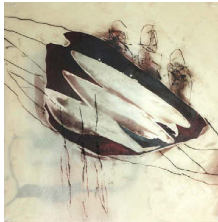
- verschworen -, 2020 25 x 25 cm Öl, Wachs, Mischtechnik