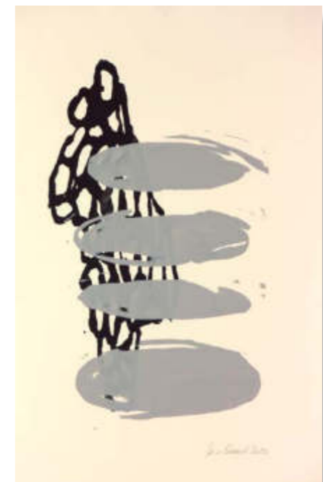
o.T., 2020, Motiv ca. 22 x 35, Blatt 35 x 50 cm Siebdruck, Unikat