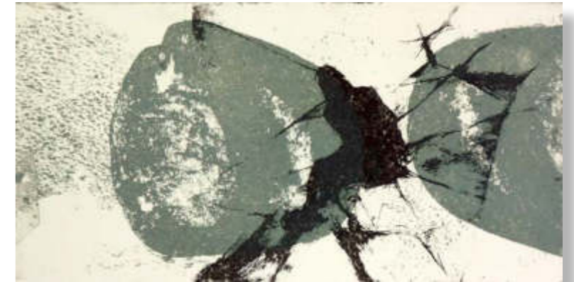
o.T., 2020, Motiv 20 x 40 | Blatt 39 x 56 cm Intagliotypie auf 300g-Bütten, Unikat