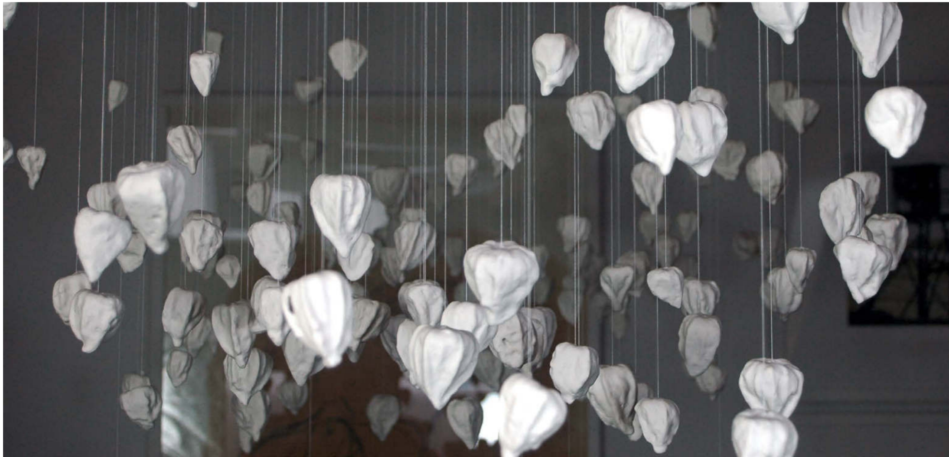
- was bleibt -, 2019 /2020 Installation Porzellan, Angelschnur, ca. 200 St. Aufhängung: Acrylglas (milchig) im Alurahmen 200 x 80 cm Höhe variabel