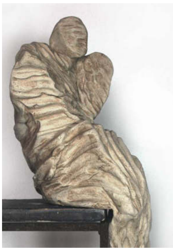
- Philosophen -, 2019 59 x 25 x 24 cm und 48 x 27 x 24 cm Keramik