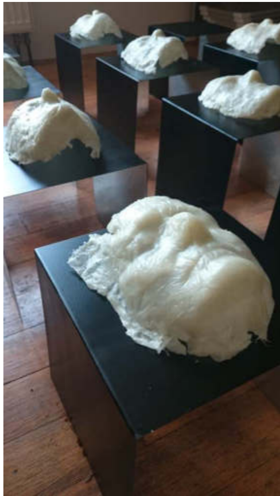
- Stille -, 2016 Bodeninstallation 16 Masken, Wachsabformung Alusockel je 25 x 25 x 25 cm