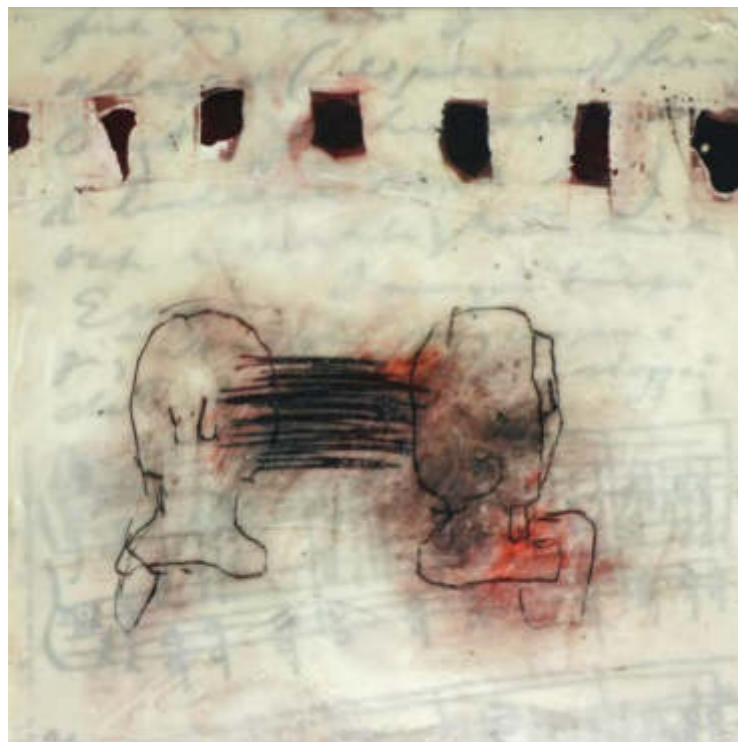
- verstrickt -, 2020 25 x 25 cm Öl, Wachs, Mischtechnik