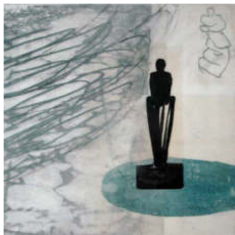
o.T., 2020, 30 x 30 x 3 cm Collage unter Wachs auf Holzkörper